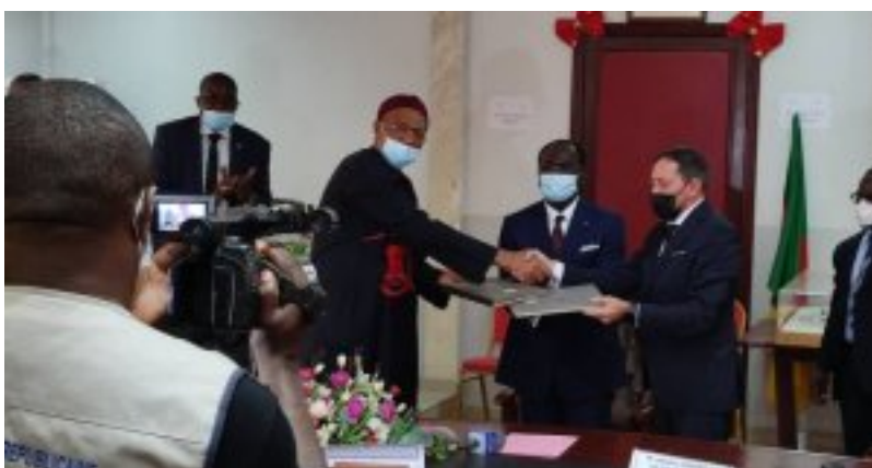
La prolongation du contrat de Toni Conceição à la tête des Lions Indomptables.

Toni Conceição a été nommé à la tête des Lions Indomptables par le Ministre Mouelle Kombi. Plus tard, sera communiquée une décision de la FECAFOOT portant nomination de tous les membres de l'encadrement. En se référant aux cas des trois derniers sélectionneurs de cette équipe, fort est de constater qu'ils ont tous signé leurs contrats au cours d'une cérémonie présidée par le Ministre des Sports. Au cours de cette cérémonie, trois parties (Ministre des sports, président de la FECAFOOT et entraîneur) signent le contrat qui lie le nouveau technicien à la sélection du Cameroun. Sans avoir à rentrer dans plus de détail, les faits ainsi établis laissent entrevoir une collaboration saine entre MINSEP et FECAFOOT.